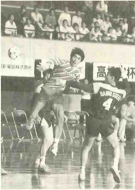
本田技研鈴鹿が大同特殊鋼を破り初優勝

第32回全日本実業団選手権男子の部は、5月17日から19日までの3日間、大阪市中央体育館に12チームが集合して熱戦を展開した。今大会V3を目指した湧永製薬が準決勝で敗退、本田技研鈴鹿が決勝で大同特殊鋼を降して初優勝を飾った。