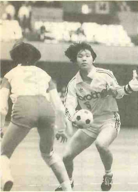
決勝はジャスコ、ブラザーの対決に

決勝 大崎電気 21 9 | 12 | 9 | 10 19 北国銀行 ジャスコ 23 12 | 11 | 13 | 9 22 ブラザー工業 【戦評】日本リーグ二部勢同士、しかも同じ東海地区のライバル同士で互いに手の内を知りつくした相手だけに、1点を争う激しい決勝戦となった。 前半はジャスコの速攻が決まって優勢に展開、一時は11-6と5点のリードを奪う。しかし、ブラザーもじりじりと追い上げ、後半7分過ぎには遂に12-12と同点に追いつく。その後一進一退の展開を見せたが、最終ジャスコが先手をとった展開で、残り1分、ブラザーは1点差に迫ったが一步及ばなかった。 得点 0072210363000 本多木永栗田江藤斐木中好 岡喜荒末小野藤進甲高畑三 GK F P 審・川内藤合 林川井出島田井田澤永師村 ジャ谷 小長今東勝福川飯成徳土松 得点 004381500020 23 (5) PT (2) 22