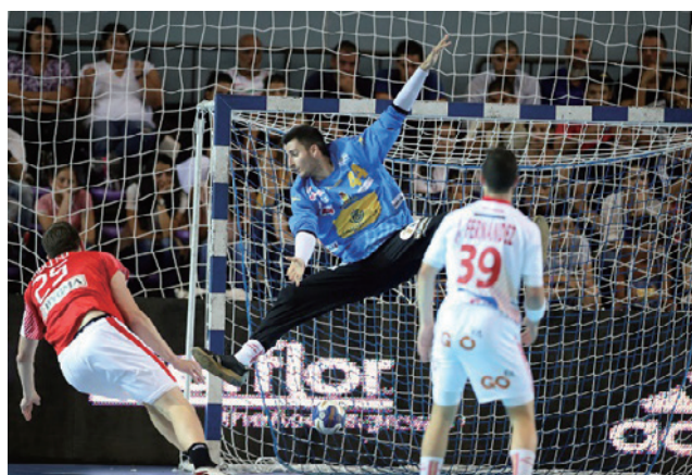
優勝したスペインのゴールキーパー スアン・レド