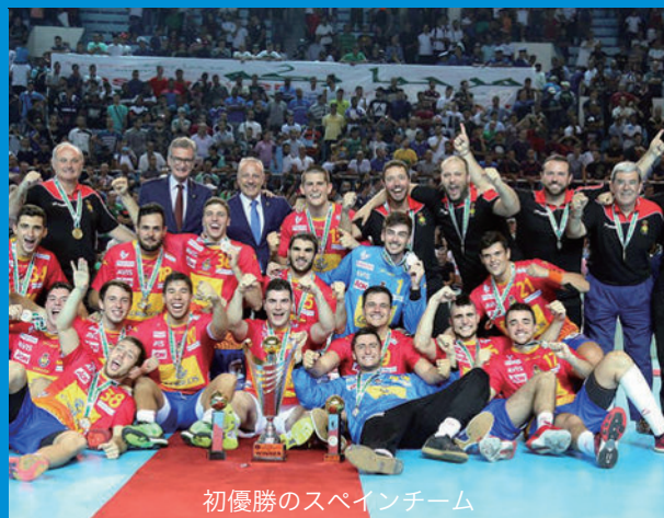
初優勝のスペインチーム

2017 男子ジュニア世界選手権は、7月17日から30日までアルジェリア・アルジェ他で開催された。アジアからは、2016年7月、ヨルダン・アンマンで開催された第15回男子ジュニアアジア選手権の上位3チーム（優勝：カタール、2位：サウジアラビア、3位：韓国）が参加、この大会4位の日本は出場していない。