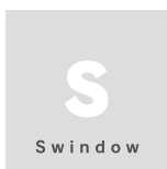
Swindow ● スウィンドウ