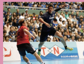
【表紙の写真】ハンドボール日韓戦 2017