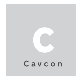
Cavcon ● キャブコン