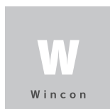
Wincon ● ウィンコン