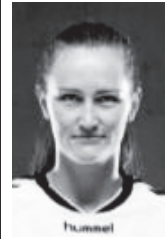
No4 RB 生年月日: 1990.02.15 身長: 178cm 体重: 76kg