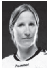
No3 PV 生年月日: 1980.04.03 身長: 174cm 体重: 70kg