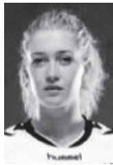
No5 PV 生年月日: 1996.09.06 身長: 179cm 体重: 69kg