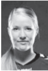
No1 GK 生年月日: 1993.03.03 身長: 178cm 体重: 77kg