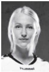
No5 LB 生年月日: 1996.08.28 身長: 173cm 体重: 68kg