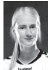
No7 LB 生年月日: 1994.09.24 身長: 182cm 体重: 69kg